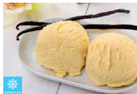
00020149 VANILLE ESSENTIELLE CREME GLACEE ARTISANALE 5L