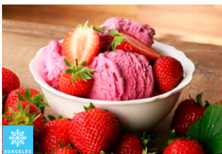
00020150 VANILLE DELICE CREME GLACEE ARTISANALE 5L