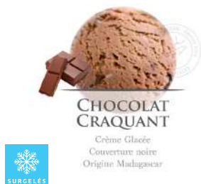
00020291 CHOCOLAT CRAQUANT CREME GLACEE ARTISANALE 2.5L