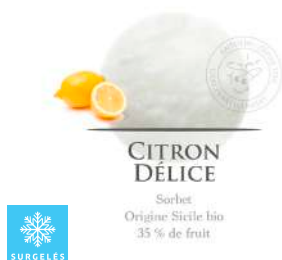
00021623 CITRON JAUNE DELICE SORBET ARTISANAL 2.5L