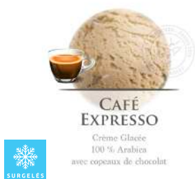
00020292 CAFE EXPRESSO CREME GLACEE ARTISANALE 2.5L