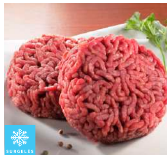
00010651 HACHE BOUCHER ROND VBF 15%MG 120G X50P