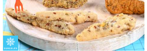
00017306 AIGUILLETTE POULET MULTIGRAINES 1K