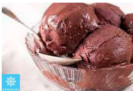
00020148 CHOCOLAT ESSENTIELLE CREME GLACEE ARTISANALE 5L