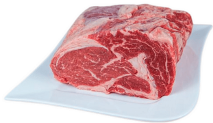
00060501 ENTRECOTE S/V ENTIERE +/-4K