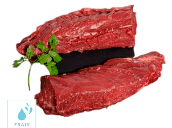
00060458 ONGLET ENTIER DE BOEUF +/-3.5K