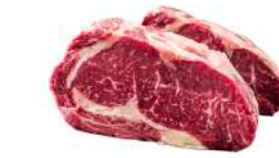
00060509 ENTRECOTE TRANCHEE S/V 300/350G X5P