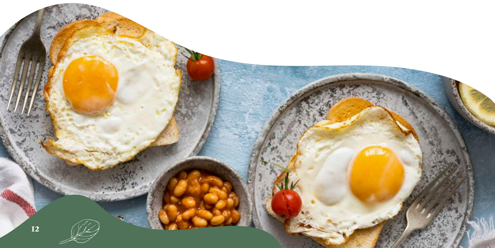
00406100 OEUF ARRADOY MOYEN 53/63 X90P