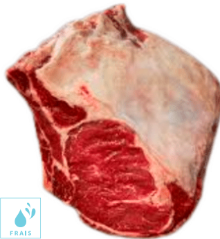
00060416 CARRE DE BOEUF DETALONNE +/-10K