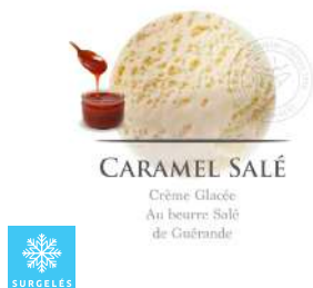
00020295 CARAMEL BEURRE SEL DE GUERANDE CREME GLACEE ARTISANALE 2.5L