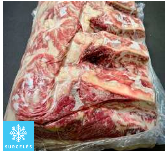
00010610 ENTRECOTE SURG U.E. +4K