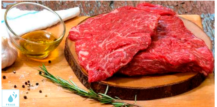
00060420 BAVETTE TRANCHEE 10P +/-200G