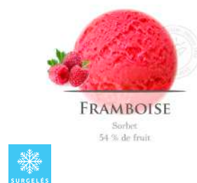
00020264 FRAMBOISE SORBET ARTISANAL 2.5L