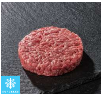
00110603 HACHE BOUCHER 125G ROND PUIGRENIER VBF 15%MG X 24P