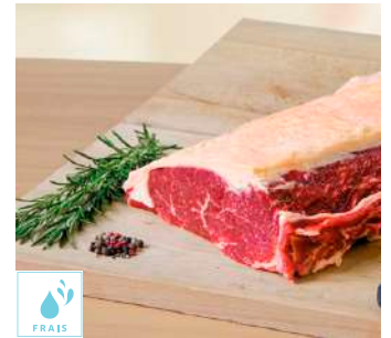
00060412 FAUX FILET AVEC OS TRANCHE S/V 400G X5P