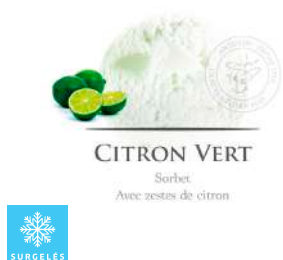
00020254 CITRON VERT SORBET ARTISANAL 2.5L