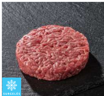
00110601 HACHE BOUCHER 150G ROND PUIGRENIER VBF 15%MG X 20P