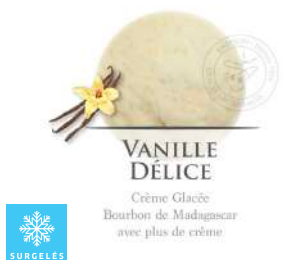
00020290 VANILLE DELICE CREME GLACEE ARTISANALE 2.5L