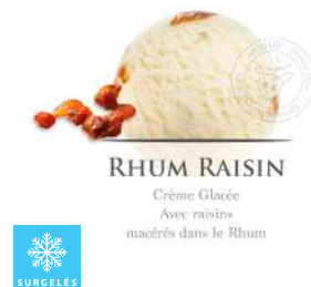
00020244 RHUM RAISINS CREME GLACEE ARTISANALE 2.5L