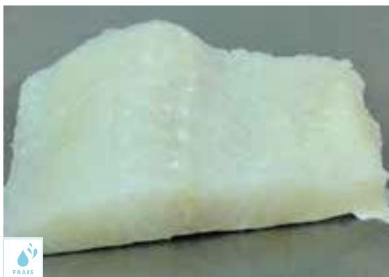
00090106 MORUE PAVE PIL-PIL DESSALEE +/-300G X2P / BACALAO TACO PIL-PIL DESALADO S/V +/-300G X2P GADUS MORHUA PECHE ANE