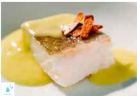
00090102 MORUE PAVE PIL PIL EXTRA S/V +/-900G / TACO BACALAO DES. PIL PIL EXTRA S/V +/-900G GADUS MORHUA PECHE ANE