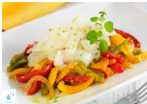
00090105 MORUE MIETTES DESSALEE S/V 1K / BACALAO MIGAS DESALADAS FRESCAS S/V 1K GADUS MORHUA PECHE ANE