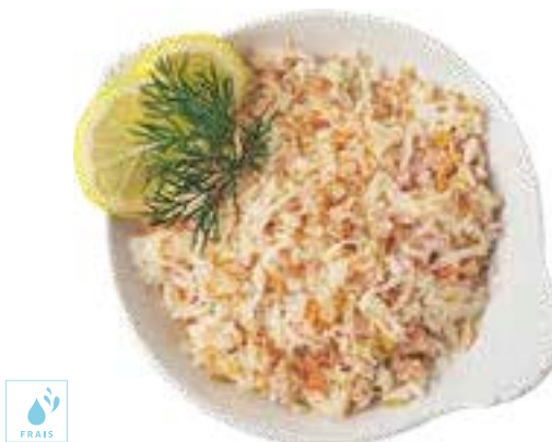
00500540 MIETTES DE SURIMI 500G / DESMIGADO DE SURIMI 500G