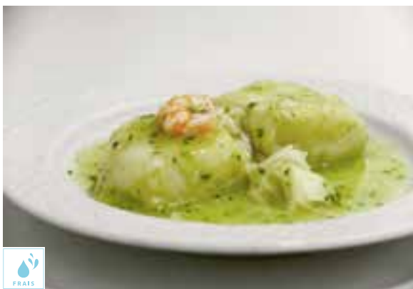
00090140 MORUE KOKOTXA +/- 1K / BACALAO KOKOTXA DESALADA +/- 1K GADUS MORHUA PECHE ANE