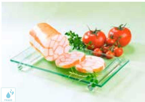
00500541 ROULE DE KAMABOKO SURIMI 1K / BARRA SURIMI 1K