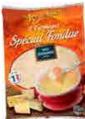
00002496 RAPE SPECIAL FONDUE 4 FROMAGES 1K QUESO MEZCLA RALLADO 3 ESPECIAL RACLETTE 1K