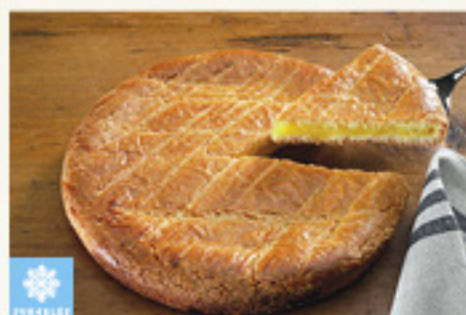
000158 GATEAU BASQUE CITRON ARTISANAL 1K PASTEL VASCO AL LIMON ARTESANAL KMO 1K