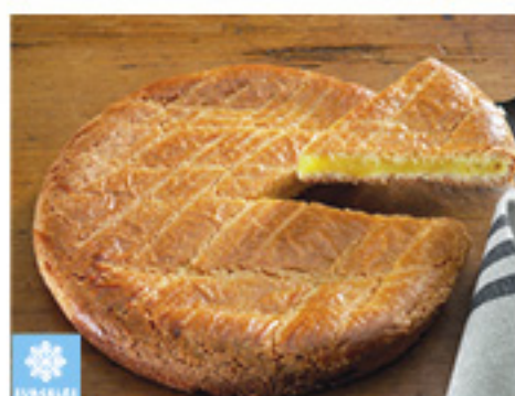
000143 GATEAU BASQUE CREME ENTIER ARTISANAL 1K PASTEL VASCO ENTERO CREMA ARTESANAL KMO 1K