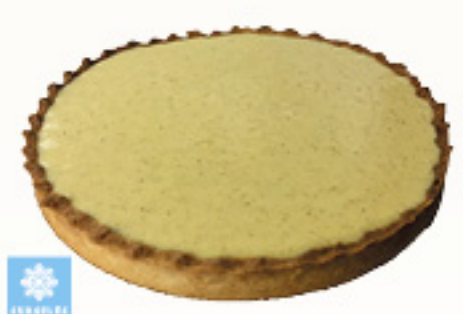
0001742 TARTE CREME BRULEE VANILLE 850G TARTA CREMA CATALANA CON VAINILLA KM0 850G