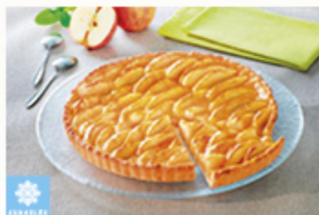
0001410 TARTE POMMES ENTIERE MAISON BONCOLAC 1K TARTA MANZANA BONCOLAC KM0 1K