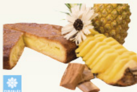
000151 GATEAU BASQUE ANANAS ARTISANAL 1K PASTEL VASCO PIÑA ARTESANAL KMO 1K