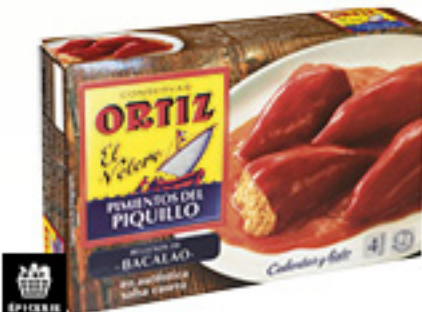
00002005 PIQUILLO FARCIE MORUE ORTIZ 300GX12P PIÑENTO RELLENO BACALAO ORTIZ KM0 300GX12P