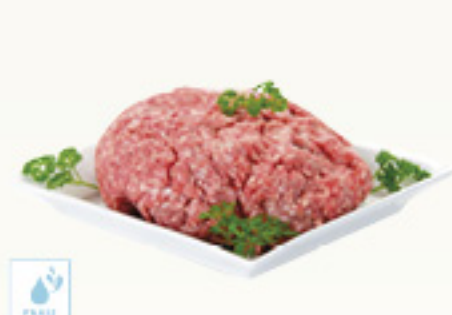
00070157 CHAIR A SAUCISSE +/- 2K CARNE PICADA PARA SALCHICHAS KM0 +/-2K