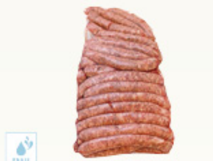
00070149 SAUCISSE FINE CHIPOLATA 36P +/- 2K SALCHICHA CHIPOLATA FINA KM0 36P +/- 2K