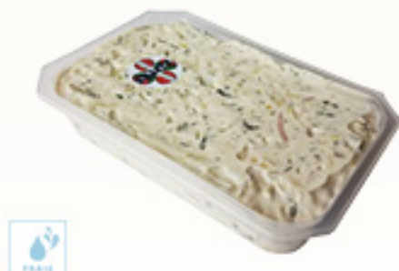
00500802 SALADE JAMBON POIREAUX ERLITA 1K ENSALADA JAMON PUERRO ERLITA KM0 1K