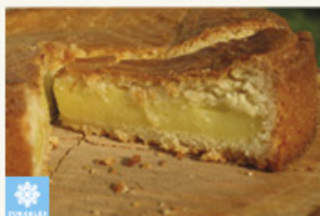
000156 GATEAU BASQUE CREME AMANDE ARTISANAL 1K PASTEL VASCO CREMA ALMENDRA ARTISANAL KMO 1K