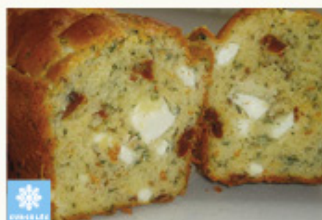
0010578 CAKE TOMATES CONFITES MOZZARELLA ARTISANAL 350G CAKE TOMATE CONFIT MOZZARELLA ARTESANAL KM0 350G