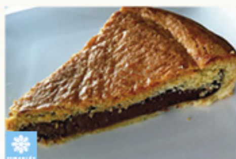
000140 GATEAU BASQUE NUTELLA ARTISANAL 1K PASTEL VASCO NUTELLA ARTESANAL KMO 1K