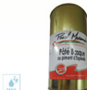
00070160 PATE BASQUE AU PIMENT D'ESPELETTE 800G PATE VASCO AL PIMIENTO DE EZPELETA KM0 800G