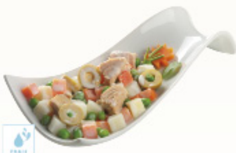
00500424 SALADE RUSSE 1K ENSALADILLA RUSA MAHN MAC KM0 1K