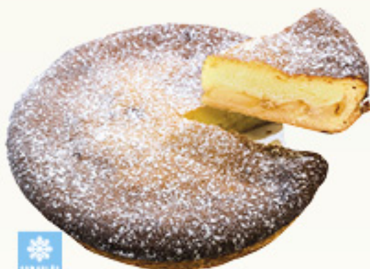
0001737 GATEAU POMMIER 1K BIZCOCHO MANZANA KM0 1K