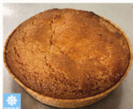
000148 GATEAU BASQUE CERISE INDIVIDUEL ARTISANAL 85G X40P I. EUSKAL PASTELA CEREZA INDIVIDUAL ARTESANAL X 40 KMO