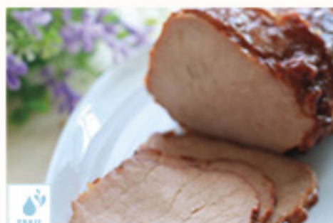
00070126 CONFIT DE PORC LONGE +/-2K CONFIT CERDO KM0 +/- 2K