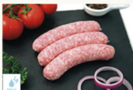
00070153 SAUCISSE DE TOULOUSE 16P +/- 2K SALCHICHA TOULOUSE GORDA KM0 16P +/- 2K