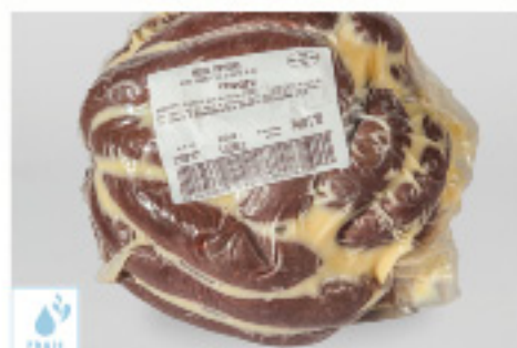
00060126 TRIPOTX 10 P +/-1K TRIPOTX KM0 10P X +/-1K