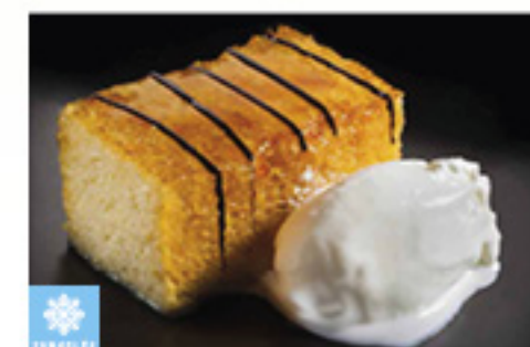
0001777 BRIOCHELLE 130G X20P BRIOCHELLE KM0 130G X20P