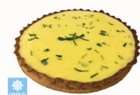
0001744 TARTE CITRON JAUNE ET VERT 850G TARTA LIMON BLANCO Y VERDE KM0 850G