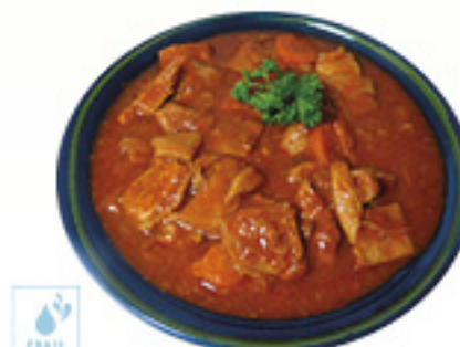
00070310 TRIPES BASQUAISE 2.4K CALLOS C/TOMATE KM0 2.4K