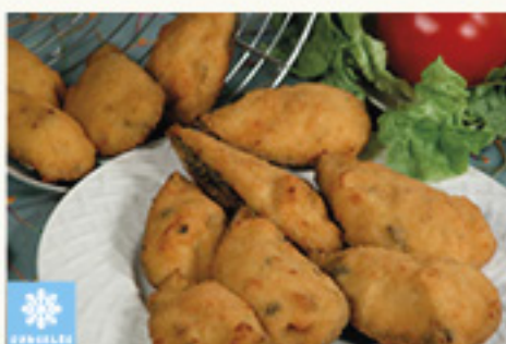
001146 MOULES FARCIES ERLITA 5K (15P/K) MEJILLON RELLENO TIGRE ERLITA KM0 5K (15P/K)