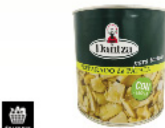
00150362 PREPARATION TORTILLA POMME DE TERRE OIGNON DANTZA KM0 3K PREPARACION TORTILLA CON CEBOLLA DANTZA 3K