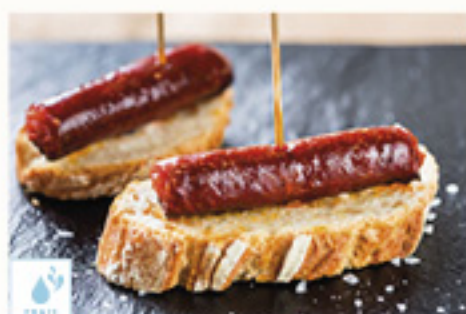
00090116 TXISTORRA ERLITA +/-1.5K TXISTORRA ERLITA +/-1.5K