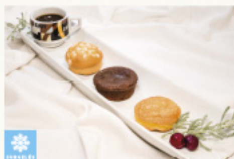
0001553 TRIO DE MIGNARDISES ARTISANALES 30G 3X16P I. TRIO PASTELITOS CAFE GOURMAND ARTESANALES KM0 30G 3X16P