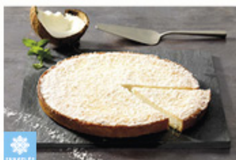
0001441 TARTE NOIX COCO INTENSE BONCOLAC 1K TARTA COCO «INTENSE» BONCOLAC KM0 1K