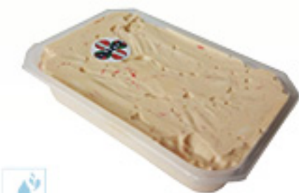
00500801 SALADE HOMARD ERLITA 1K ENSALADA BOGAVANTE ERLITA KM0 1K