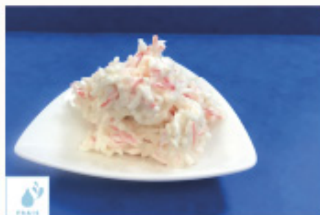
00500426 SALADE PINTXO DU NORD 1K ENSALADA PINTXO DEL NORTE MAHN MAC 1K