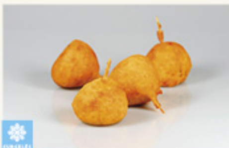
000117 BEIGNET DE FRUITS MER ERLITA 30P 1.2K BOLAS DE MARISCO ERLITA KM0 30P 1.2K