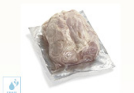
00070295 JARRET DE JAMBON CUIT COUPE EN 2 +/-1.1K CODILLO CERDO COCIDO CORTADO KM0 +/- 1.1K