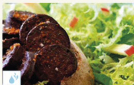
00070169 BOUDIN AU PIMENT D'ESPELETTE +/-10P +/-2K MORCILLAS PIMIENTO EZPELETA KM0 +/-10P +/-2K