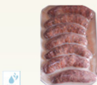
00070127 SAUCISSE CONFITE 2.4K X20P SALCHICHA CONFITADA KM0 S/V 2.4K X20P