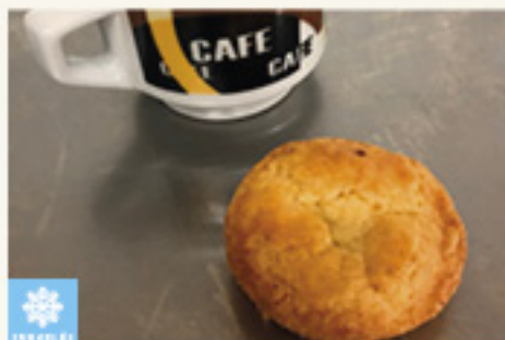
0001554 MINI BASQUE CERISE POUR CAFE GOURMAND ARTISANAL 30G X64P I. PASTEL VASCO CEREZA CAFE GOURMAND ARTESANAL KM0 30G X64P