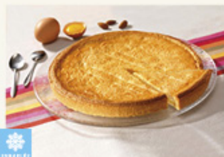
0001400 GATEAU BASQUE CREME ENTIER BONCOLAC 1K PASTEL VASCO ENTERO BONCOLAC KM0 1K