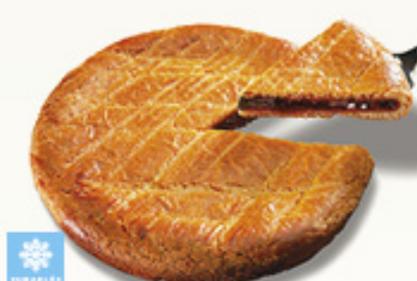
000147 GATEAU BASQUE CERISE PREDECOUPE ARTISANAL 8P PASTEL VASCO CEREZAS PRECORTADO ARTESANAL KMO 8P