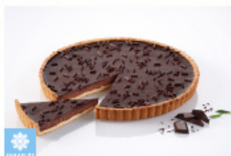
0001430 TARTE CHOCOLAT ENTIERE BONCOLAC 900G TARTA CHOCOLATE ENTERA BONCOLAC KM0 900G