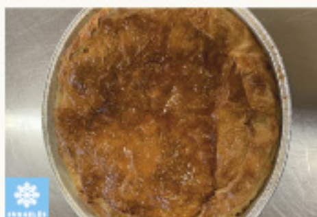
0001555 TOURTIERE LANDAISE POMMES ET ARMAGNAC ARTISANALE 600G TARTA TOURTIERE MANZANA Y ARMAGNAC ARTESANAL KM0 600G