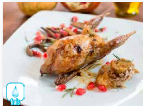
40907 PERDREAU ROUGE FRAIS PERDIZ ROJA P.N.V.D. COLIS DE 12PIECES