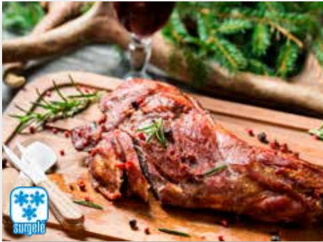
11512 EPAULE DE CHEVREUIL PALETILLA DE CORZO PIECE DE 1/1.2KG