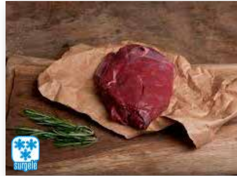
11513 VIANDE DE CHEVREUIL SANS OS CARNE GUIJAR CORZO S/HUESO POCHE DE 2.5KG