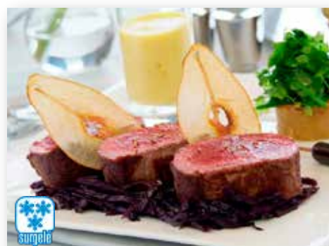
11508 FILET DE CERF DOS LOMO CIERVO DESHUESADO PIECE DE +/-2KG