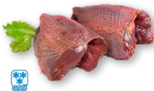
11501 FILET DE RAMIERS SANS PEAU PECHUGA PALOMA PIECE DE 50/60GR-COLIS DE 10PIECES