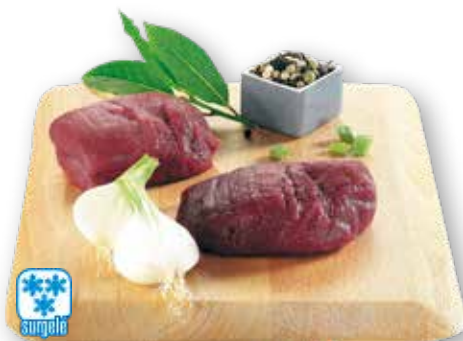
11509 PAVE DE CERF S/V TACO CARNE CIERVO S/V PIECE DE 130/150GR-COLIS DE 4PIECES