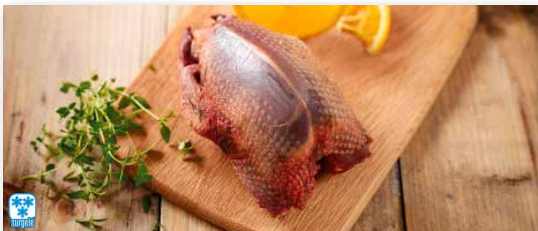
11500 RAMIER SURGELÉ PAC PALOMA P.A.C. LIMPIA PIECE DE 280GR-COLIS DE 10PIECES