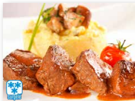
11510 SAUTE DE CERF CARNE CIERVO PARA GUIJAR POCHE DE 2.5KG