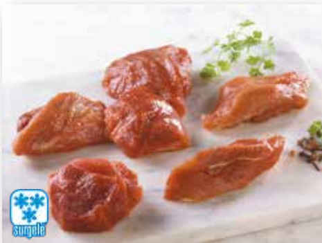
11517 SAUTE DE SANGLIER CARNE GUIJAR JABALI SIN HUESO POCHE DE 2.5KG